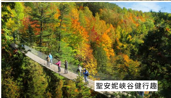
聖安妮峽谷健行趣