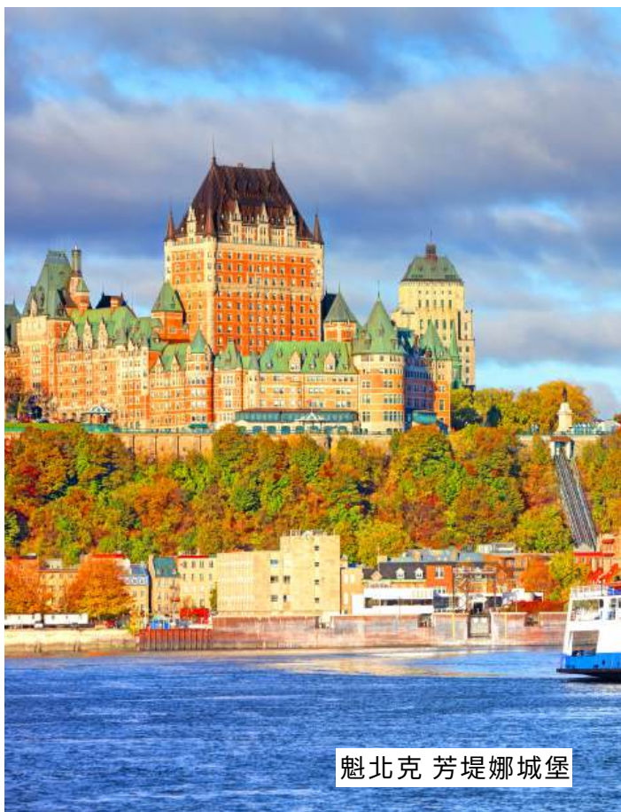
魁北克 芳堤娜城堡

我們特別安排在魁北克市區的飯店連泊2晚，讓您有充足時間好好領略法國氛圍的古城浪漫風情。絕非一般旅行團拉到郊區住宿，無緣欣賞古城浪漫夜色。