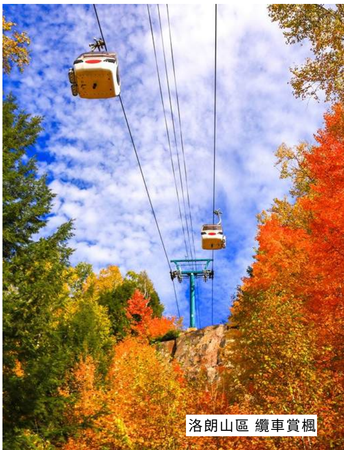
洛朗山區 纜車賞楓

特別安排住宿在渡假村內當地最棒的——費爾蒙城堡級旅館，擁有更充裕的時間享受楓紅之美，徜徉賞楓勝境。旅館房間洋溢鄉紳別墅的溫馨舒適氛圍，窗外在秋色烘托下更顯秀麗。