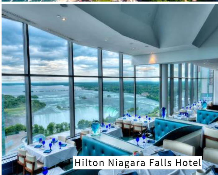
Hilton Niagara Falls Hotel