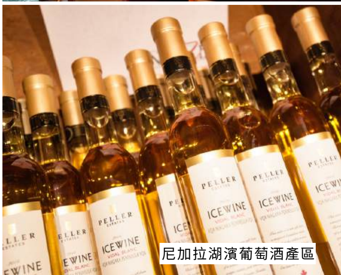
尼加拉湖濱葡萄酒產區