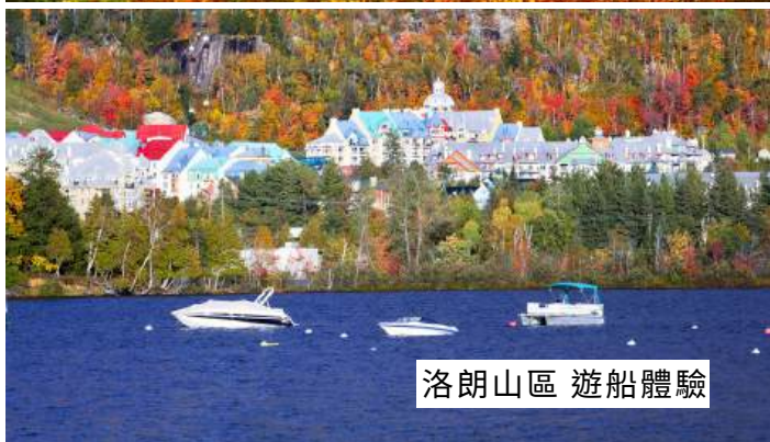
洛朗山區 遊船體驗